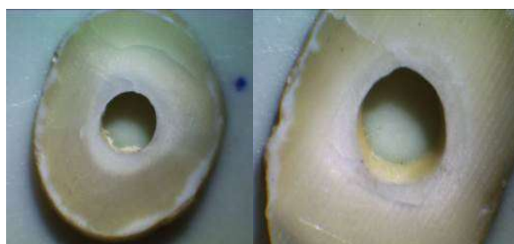
شکل ۱- الگوی شکست ادهزیو (سمت راست) و ترکیبی (سمت چپ)

شکست ترکیبی (mix): اگر شکست هم در اینترفیس و هم در پست یا سمان رزینی اتفاق بیفتد.