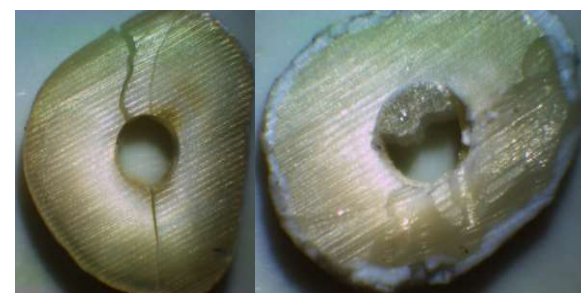
شکل ۲- الگوی شکست کوهزیو (سمت راست)، نمونه خارج شده از آزمایش (سمت چپ)