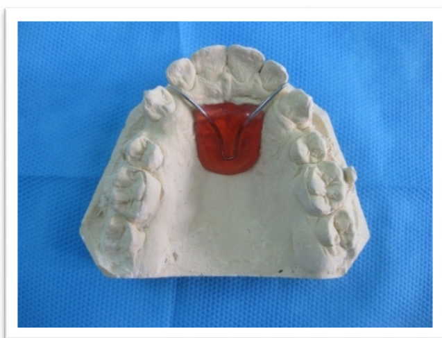
شکل ۱- پلاک رفرنس

کست‌های تهیه شده در ابتدای Retraction و ۴ و ۸ هفته بعد، تریم شدند و پاپیلای انسیزیو و رافه میانی کام بر روی آنها مشخص گردید. بر روی کست اولیه هر بیمار پلاک آکریلی در ناحیه روگا به نحوی ساخته شد که فقط قسمت مرکزی روگای پالاتال را بپوشاند و سیم‌های رفرنس بر روی کست با سیم ۰/۹ میلی‌متر داخل پلاک آکریلی قرار گرفتند (شکل ۱).