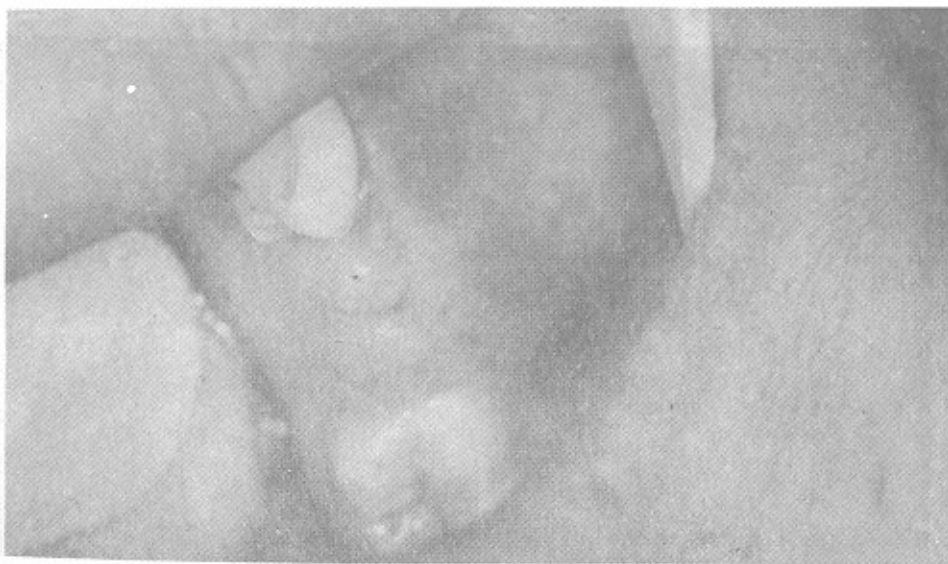
شکل ۲- Expansion باکالی ضایعه را نشان می دهد