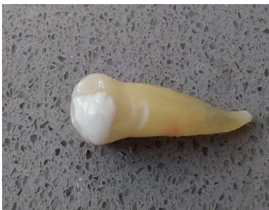
شکل ۲- ترمیم حفره دسترسی توسط رزین مودیفاید گلس آینومر

هیپوکلوریت سدیم برر سی شد. تعداد نمونه‌ها با در نظر گرفتن سطح اطمینان ۹۵٪ و توان ۸۰٪ و همچنین انحراف معیار ۱/۶۴ برای نمره تطابق لبه‌ای و در نظر گرفتن اختلاف ۲ واحدی میانگین بین دو گروه MTA Angelus و سرامیک سرد، با استفاده از فرمول زیر برای هر گروه ۱۰ عدد برآورد شد.