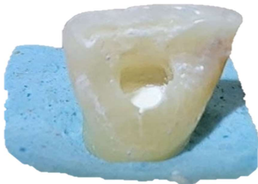
شکل ۱- قرار گرفتن مواد درون حفره دسترسی با ضخامت ۳ میلی متری

اندازه‌گیری و استاندارد سازی با استفاده از پروب) درون حفره دسترسی قرار گرفت (شکل ۱). نمونه‌ها در محیط خشک و بدون تابش مستقیم آفتاب نگهداری شدند. پس از اطمینان از سفت شدن سرامیک سرد و MTA Angelus به مدت ۲۴ ساعت، حفره‌های دسترسی توسط رزین مودیفاید گلس آینومر (FujiII, LC, GC, Japan) ترمیم شدند (شکل ۲). سپس نمونه‌ها به صورت جداگانه درون لوله‌های حاوی بزاق مصنوعی قرار داده شده و در همان شرایط محیطی (در محلول بزاق مصنوعی به دور از تابش مستقیم آفتاب) نگهداری شدند. این محلول هر دو هفته یک بار تعویض گردید. برای باقی ماندن بیوسرامیک‌ها در حفره دسترسی و جلوگیری از داخل شدن آن‌ها به داخل کانال از مقدار کمی گلس استفاده شد.