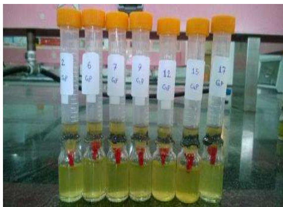
شکل ۳- اندازه گیری ریزنشست به روش نفوذ باکتریایی در نمونه‌های گوتاپرکا در روز سی ام

جهت آنالیز داده‌ها از نرم‌افزار آماری SPSS22 استفاده شد. ریزنشست دو گروه در روش الکتروشیمیایی با آزمون Student T و در روش نفوذ باکتری با آزمون دقیق فیشر مورد قضاوت آماری قرار گرفت. میزان خطای نوع اول در تحقیق حاضر برابر 0/05 لحاظ گردید ( \alpha=0/05 ).