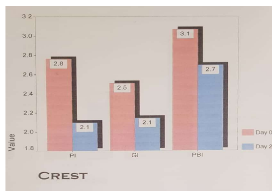
نمودار ۲- نمودار مقایسه ایندکس‌های پلاک، لثه‌ای و خونریزی از لثه قبل و بعد از درمان در گروه کنترل