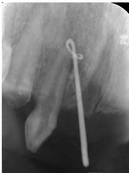
شکل ۲- trace کردن سینوس ترکت

پیشنهاد می‌کرد، اما به منظور اطمینان از چند رادیوگرافی پری اپیکال با زاویه‌های مختلف استفاده شد. باید به این نکته اشاره کرد که بیمار در دندان ۱۲ هیچ دردی گزارش نداده و دندان لقی درجه ۱ را نشان می‌داد و در دق نیز کاملاً نرمال بود. تست‌های حیات پالپی شامل تست سرما (Roeko endo-frost, coltene/whaledent, Germany) و الکتریک پالپ تست (C-pulse pulp center, US dental deport, USA) انجام شد که پاسخ منفی بود. بر اساس یافته‌های بالینی و رادیوگرافی، تشخیص تحلیل داخلی التهابی ریشه و پریودنتیت اپیکالی مزمن در دندان ۱۲ در نظر گرفته شد و درمان ریشه به عنوان درمان انتخابی و قطعی در نظر گرفته شد (شکل ۲).