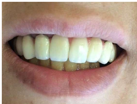
شکل ۹- پس از درمان پروتز

با توجه به نیاز مبرم به ایجاد سیل سه بعدی و درمان پرچالش دندان‌های با تحلیل داخلی ریشه، روش‌های مختلفی برای پرکردن این دندان‌ها مطرح شده‌اند که از جمله آن‌ها به روش single cone و استفاده از سیلرهای با بیس کلسیم سیلیکات می‌توان اشاره کرد. لذا در کیس مورد بررسی از روش single cone و سیلر Endosel MTA استفاده گردید.