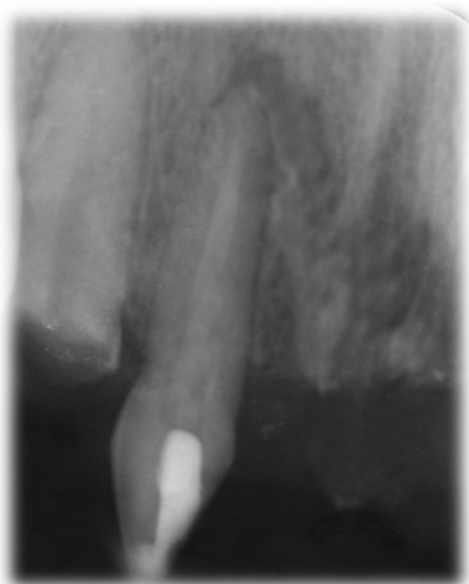
شکل ۳- قرار دادن کلسیم هیدروکساید در لترال راست ماگزایلا

یک هفته بعد، بیمار در مراجعه بعدی (یک هفته بعد) سینوس ترکت بیمار بهبود یافته بود (شکل ۴).