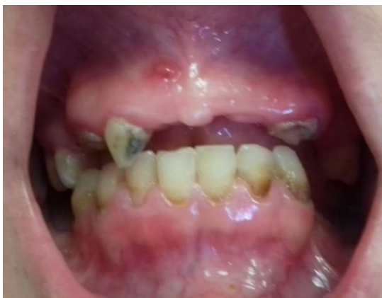
شکل ۱- سینوس ترکت در ناحیه قدامی ماگزایلا

بیمار خانم ۳۱ ساله به بخش اندودنتیکس دانشکده دندانپزشکی دانشگاه علوم پزشکی تهران با شکایت اصلی درد شدید در دندان پره مولر دوم ماگزایلا مراجعه کرد. او هیچ مشکل سیستمیکی نداشت و کاملاً سالم بود. در پرونده درمانی دندانپزشکی بیمار، تاریخچه‌ای از ترمیم تاجی و پرکردگی برخی دندان‌ها وجود داشت. معاینات داخل دهانی نشان داد که بافت پریودنتال بیمار طبیعی بود، اما بهداشت دهان وی نامناسب بود و دندان‌های زیادی پوسیدگی داشتند و حساسیت به دق در دندان ۱۵ وجود داشت و در مخاط ناحیه پری اپیکال دندان ۱۲ (بدون پوسیدگی و ترمیم تاجی) سینوس ترکت وجود داشت (شکل ۱). معاینات رادیوگرافی پوسیدگی اکلوزالی دندان ۱۵ را نشان داد که نزدیک پالپ چمبر دندان بود. یک رادیوگرافی به منظور ردیابی سینوس ترکت در ناحیه قدامی تهیه شد. تشخیص برای دندان ۱۵ پالپیت غیر قابل برگشت بود اما هیچ پوسیدگی در دندان ۱۲ مشاهده نشد.