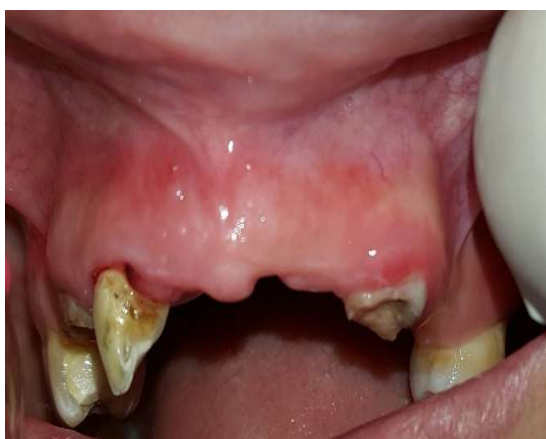
شکل ۴- بهبود سینوس ترکت

پس از تهیه رضایت نامه شفاهی و کتبی از بیمار، پیش از شروع درمان کانال ریشه، بیمار از تشخیص و طرح درمان مطلع شد. سپس بی حسی موضعی لیدوکائین ۲٪ با اپی نفرین ۱/۸۰۰۰۰ تزریق شد و دندان ۱۲ با رابردم ایزوله و حفره دسترسی با هندپیس با سرعت بالا تحت اسپری آب و هوا تهیه شد. کانال‌ها با ۲.۵٪ NaOCl (Diluted chloraxid 5.25% cerkamed, medicalcompany, Poland) شستشو داده شد و طول کارکرد دندان با اپکس لوکتور (Meta biomed, southkorea) I root اندازه‌گیری و با رادیوگرافی تأیید شد. آماده سازی بیومکانیکال کانال‌ها با فایل روتاری نیکل تیتانیوم (Dentsply, mailifer) Protaper به روش crown down تا فایل F4