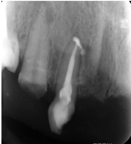
شکل ۶- فالوآپ ۳ ماهه