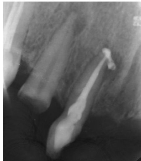
شکل ۵- رادیوگرافی بلافاصله پس از آبجوریشن

داروی داخل کانال خارج شد و کانال‌ها با ۵ میلی لیتر ۱۷٪ EDTA (Morvabon, Iran) به مدت ۱ دقیقه و سپس ۵ میلی لیتر ۲.۵٪ NaOCl به مدت ۱ دقیقه برای برداشت اسمیرلیبر شستشو داده شد. سپس کانال‌های ریشه با کن‌های کاغذی استریل خشک شد و کانال‌ها با گوتاپرکا و سیلر Endoseal MTA پر شدند. تیپ پلاستیکی تا رسیدن به طول وارد کانال شد و سپس سیلر به درون کانال تزریق شد و یک کن اصلی (master cone) (6%، #40) آغشته با Endoseal MTA داخل کانال تا طول کارکرد قرار داده شد و کانال به روش single cone پر شد. پس از پر کردن کانال گوتاپرکای اضافی به کمک وسایل داغ دستی خارج شد. در انتها پالپ چمبر با الکل اتیلیک ۷۰٪ تمیز و دندان با ماده ترمیم موقت پر شد. رادیوگرافی پس از پرکردگی کانال ریشه دندان، پر شدن کامل سیستم کانال ریشه را نشان داد، اما میزان کمی اکستروژن Endoseal MTA در سطح جانبی ریشه وجود داشت (شکل ۵).