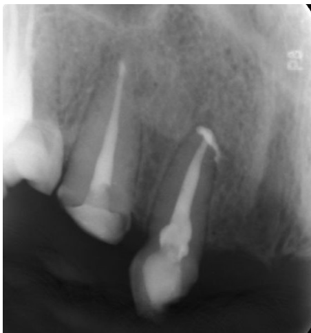
شکل ۷- فالوآپ ۶ ماهه