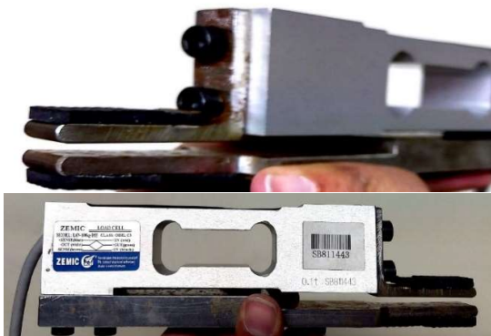
شکل ۱- دستگاه ثبت نیروی بایت

zimec با ظرفیت ۱۰۰ کیلوگرم استفاده شد که توسط دو بازوی فلزی که به آن متصل شده بود، قابلیت گاز گرفته شدن توسط بیمار را پیدا کرده بود. در قسمت بایت لایه‌ای لاستیکی اضافه شد تا بایت روی فلز انجام نشود و راحت‌تر صورت گیرد (شکل ۱). میزان نیروی وارده توسط بیمار در یک نمایشگر و با واحد نیوتن قابل مشاهده بود. ابتدا روکش یکبار مصرف روی سر وسیله قرار داده شد. سپس سر سنسور روی سطح دندان مولر اول مندیبل/ماکزایلا قرار داده شد (۱۱، ۱۰، ۴) و از افراد خواسته شد تا در حالی که سر آن‌ها به جایی تکیه ندارد با حداکثر نیروی ممکن سر سنسور را به مدت ۲ تا ۳ ثانیه گاز بگیرند. سپس به مدت ۲۰ ثانیه استراحت کنند. این عمل ۲ بار دیگر تکرار شد. حداکثر مقدار اندازه‌گیری شده مبنای محاسبه قرار گرفت. اندازه‌گیری معیارهای صورتی به وسیله دو کولیس دیجیتال انجام شد که به یکی از آن‌ها برای اندازه‌گیری راحت‌تر ابعاد، سر بازویی اضافه شد (شکل ۲).