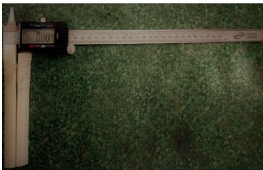
شکل ۲- کولیس مورد استفاده در پژوهش

فاصله بین نقاط Nasion-Gnathion و Nasion-Subnasal و Gonion-Gonion و Zygoma-zygoma و Subnasal- Gnathion و Biparietal و Glabella- Opisthocranion از روی صورت و سر افراد