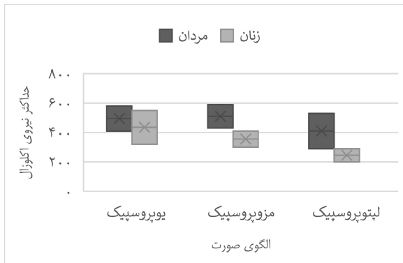
نمودار ۲- حداکثر نیروی اکلوزال و جنس و الگوی صورت

بر طبق آنالیز آماری رابطه معنی‌داری بین حداکثر نیروی اکلوزال و هیچ یک از فرم‌های سه گانه سر وجود نداشت ( P=0/۸۱۳ ). طبق تست correlation بین الگوی سر و صورت رابطه معنی‌داری وجود نداشت ( P=0/۵۲۳ ). حداکثر نیروی اکلوزال در مردان همواره بیشتر از زنان بود و این بیشتر بودن در هر یک از الگوهای صورتی نیز برقرار بود. به طور مثال در مردان یوپروسپیک میزان MOF از زنان یوپروسپیک بیشتر بود و این بیشتر بودن در هر یک از فرم‌ها به یک نسبت در مردان از زنان بود به همین دلیل از لحاظ آماری معنی‌دار نبود (نمودار ۲).