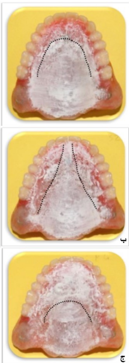
شکل ۴- پالاتوگرافی موقعیت تعیین شده کام سخت با خمیر فشار نما. الف) تلفظ حرف «ت و د»، ب) تلفظ حروف «س و ز»، ج) تلفظ حروف «ک و گ»

اصلاح شد که با تماس مناسب زبان و کام، صداها به شکل واضح و راحت قابل تلفظ باشند (شکل ۴).