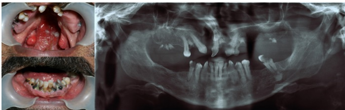
شکل ۱- فوتوگرافی و رادیوگرافی بیمار در مراجعه اولیه و پیش از آغاز درمان

درمان انتخابی در این بیمار پیوند استخوان و استفاده از پروتز متکی بر ایمپلنت بود که با توجه به اندازه ضایعه، سن و خواست بیمار و