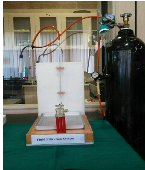
شکل ۱- دستگاه اندازه‌گیری فیلتراسیون مایع

مطالعه دیگری که توسط Borges و همکاران (۲۰) (۲۰۱۰) بر روی خصوصیات فیزیکی و شیمیایی Bio MTA و ProRoot MTA و سمان پورتلند انجام شد نشان داد که تفاوت چشمگیری بین نسبت آب به پودر در دو ماده Bio MTA و ProRoot MTA وجود ندارد و