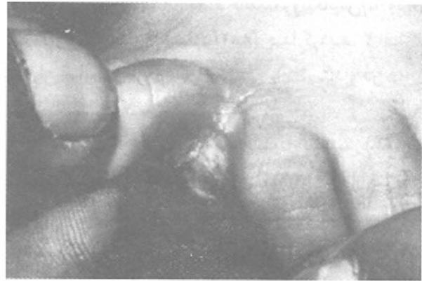
تصویر شماره ۴- ضایعات کاندیدیایی بین انگشتان

از نظر شمارش لئوسیت‌های T در خون محیطی از آزمون روزت (Rosette) استفاده گردید و میزان IgM و IgG در بیماران ارزیابی گردید (جدول شماره ۵).