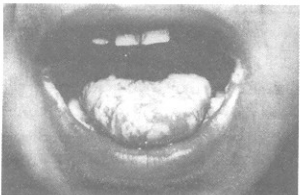
تصویر شماره ۲- برفک ایجادشده به صورت غشای کاذب سفیدرنگ