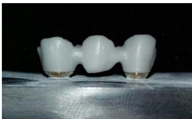
شکل ۲- یکی از فریم ورک زیرکونیای بر روی مدل اصلی