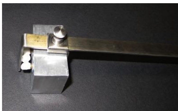
شکل ۳- کلمپ نگه دارنده فریم ورک بر روی مدل اصلی