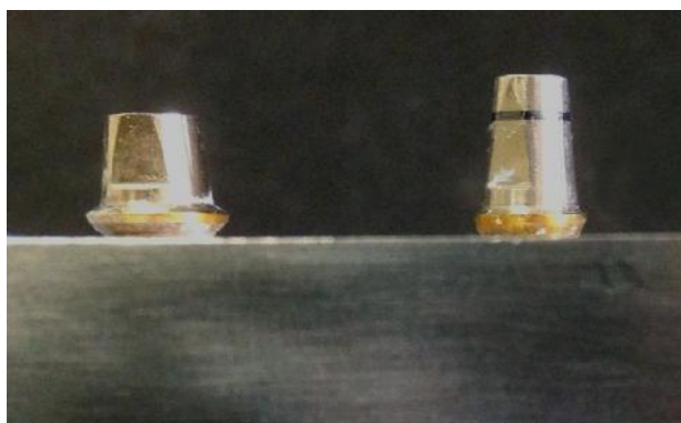
شکل ۱- مدل اصلی حاوی دو اباتمنت ایمپلنتی با سایزهای متفاوت