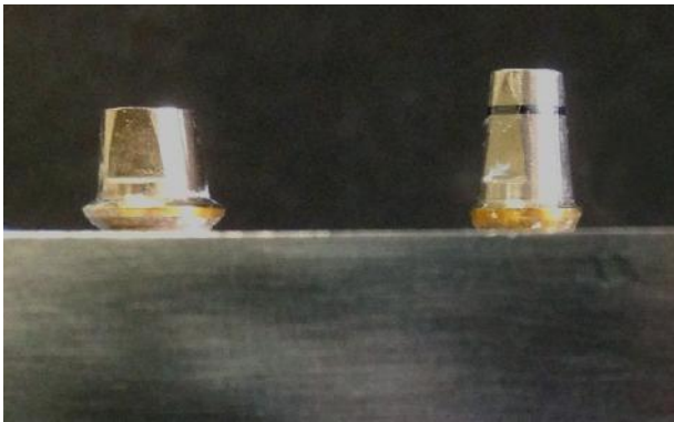
شکل ۱- مدل اصلی حاوی دو اباتمنت ایمپلنتی با سایزهای متفاوت