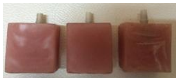
شکل ۱- مجموعه ایمپلنت و اباتمنت‌های زیرکونیایی قرار داده شده در آکريل

برای انجام این مطالعه تجربی از سه ایمپلنت Branemark با اتصال هگزگونال خارجی (Noble biocare AB, Göteborg, Sweden) و Replace با اتصال سه گوش داخلی (Noble active, Noble Biocare AB, Göteborg, Sweden) با اتصال هگزگونال داخلی سوئیچ شونده (Noble biocare AB, Göteborg, Sweden) با قطر متوسط (۴/۳ میلی‌متر) استفاده شد. به منظور یکسان‌سازی موقعیت، هرکدام از مجموعه‌های ایمپلنت و اباتمنت در ظرف پلاستیکی با آکريل خودپلیمریزه شونده (GC America INC, Alsip, USI)، با کمک Surveyor (Degussa, VGI, Germany) به صورت عمود مانت شدند (شکل ۱).