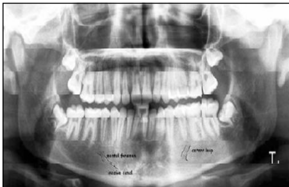
شکل ۱- رادیوگرافی پانورامیک (چپ) و پانورامیک بازسازی شده از CBCT (راست) نشان دهنده محل انشعاب کانال ثنایایی از کانال مندیبولار می باشد.

کانال مندیبولار یکی از ساختارهای آناتومیک نرمال فک تحتانی مرتبط با درمان ایمپلنت است که از سوراخ مندیبولار در راموس به صورت مورب به طرف پایین و قدام آمده و سپس در تنه مندیبل به صورت افقی پیش می رود. عمدتاً مابین ریشه های پرمولر اول و دوم و یا زیر پرمولردوم پایین، این کانال به دو قسمت چانه ای و ثنایایی تقسیم می شود که شاخه چانه ای با یک چرخش به سمت بالا و دیستال به نام حلقه قدامی از محل سوراخ چانه ای در سطح باکال مندیبل خارج می شود و شاخه ثنایایی نیز از داخل کانال ثنایایی زیر ریشه دندان های ثنایای پایین تا محل سوراخ زبانی امتداد می یابد (۱،۲) (شکل ۱).