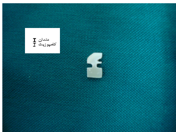
شکل ۱- نمونه‌های دمبلی شده با سطح مقطع ۱ mm 2