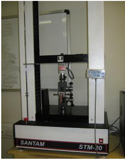
شکل ۲- دستگاه UTM