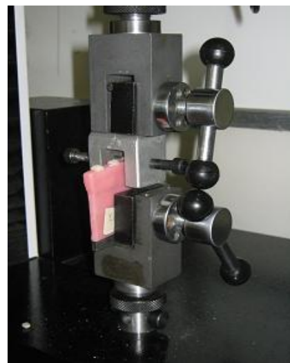
شکل ۱- تصاویر لوازم مورد نیاز برای آزمایش باندینگ توسط استاندارد

(Silane, 3M ESPE, US) و به دسته دوم مونومر (Monomer, Dental industry, Iran Acrylic, Iran polymer) زده شد. عملیات مغل‌گذاری و پخت روی آن‌ها انجام شد و دندان‌ها به آکریل (Iran acrylic polymer, Dental industry, Iran) متصل گردیدند. پس از حذف آکریل‌های اضافی و پرداخت نمونه‌ها، اتصالات هر یک از دندان‌ها به بیس آکریلی‌شان با دقت کنترل شد و در صورت بی‌نقص بودن محل چسبندگی دندان‌ها با بیس آکریلیشان برای آزمایش انتخاب شدند. تست کشش این نمونه‌ها توسط دستگاه (Santam STM-20, (UTM) Universal Testing Machine (Iran) انجام شد (شکل ۲). هر یک از نمونه‌ها به فک (گیره) (شکل ۳) دستگاه کشش ثابت شده و از طرف دیگر در جهت مخالف آن تحت تأثیر نیروی کششی توسط قلابی (شکل ۴) که فقط در لبه اینسوزالی دندان درگیر بود، با سرعتی معادل ۱ میلی‌متر بر دقیقه قرار داده شد تا زمانی که دندان در اثر نیروی وارده شکسته و یا از بیس خود خارج شد (شکل ۲). نیرویی که باعث شکست گردید، ثبت و برای تحلیل نتایج از آن‌ها استفاده شد. براساس استاندارد، جواب مثبت آزمایش هر یک از نمونه‌ها زمانی است که خود دندان و یا آکریل بیس نگهدارنده دندان بشکند ولی محل اتصال دندان با بیس آکریلی‌شان نیروی وارده را تحمل کند. جواب منفی زمانی است که محل اتصال دندان با بیس آن تحمل نیروی کششی وارده را ندارد و دندان از جایگاه خود به طور کامل خارج شود. بعد از انجام این آزمایش برای کلیه