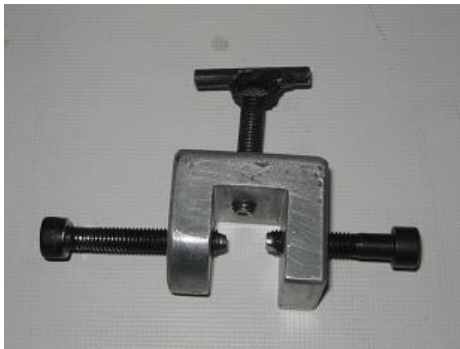
شکل ۳- گیره مخصوص نگهداری بیس آکریلی