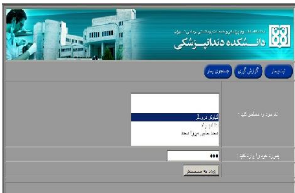
شکل ۱- صفحه Login