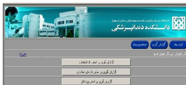
شکل ۵- صفحه گزارش‌گیری