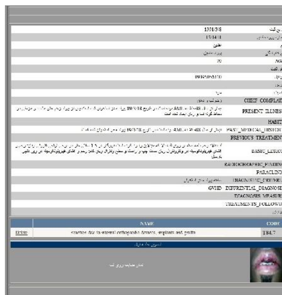
شکل ۶- نمونه‌ای از صفحه گزارش‌گیری