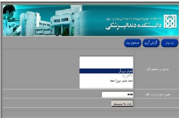
شکل ۱- صفحه Login