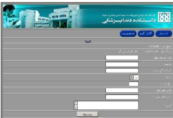
شکل ۲- صفحه ثبت داده ها