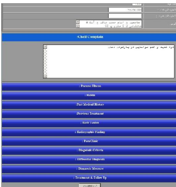
شکل ۳- نوارهای ورود داده ها براساس فرمت پرونده های بخش بیماری های دهان و فک و صورت

Agile ماکروسافت به کار رفت. برای پیاده سازی و ساخت پایگاه داده ها از موتور 2008 SQL server و برای گزارش گیری از موتور SQL reporting services استفاده شد. جهت طراحی ساختار اصلی، زبان برنامه نویسی Vb.net در محیط Visual studio 2010 که در فریم ورک Net4. پیاده سازی شده است، به کار رفت. در ابتدا عناصر اصلی سیستم آنالیز و مشخص شده و سپس نیازها و خصوصیات هر یک تعیین گردید. در مرحله بعد دیاگرام روابط آن ها (ارتباطات) رسم شده و سپس طبق خصوصیات آنالیز شده، جداول هر یک از آن ها طراحی گردید.