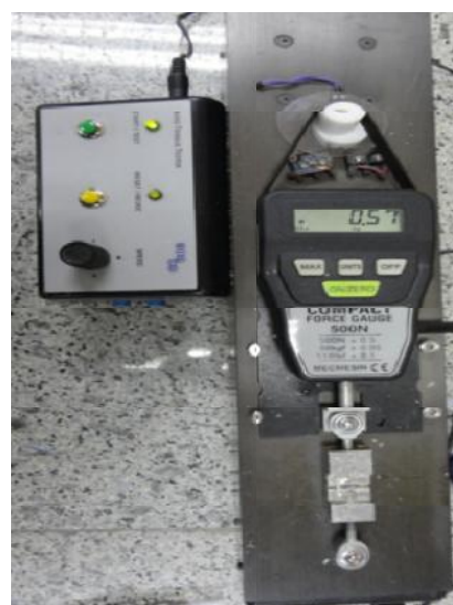
شکل ۴- دستگاه سنجش استحکام باند

گروه تحت تابش لیزر ۳۰۰ میلی ژول استحکام باند پایین‌تری را نسبت به گروه بدون تابش لیزر نشان داد ( P < 0.05 ). سایر گروه‌ها تفاوت معنی‌داری با هم نداشتند ( P > 0.05 ). یافته‌ها در جدول ۱ خلاصه شده است. تمام نمونه‌هایی که پس از شکست از دستگاه سنجش استحکام باند به طور سالم خارج شدند، مورد بررسی توسط میکروسکوپ نوری قرار گرفتند. گرچه به علت سایز کوچک نمونه‌ها، شکستگی در بسیاری از آن‌ها مانع بررسی دقیق بعدی شد. نتایج در جدول ۲ آمده است. در تمام نمونه‌ها نوع غالب شکستگی به صورت کوه‌زیو در کامپوزیت بوده است.