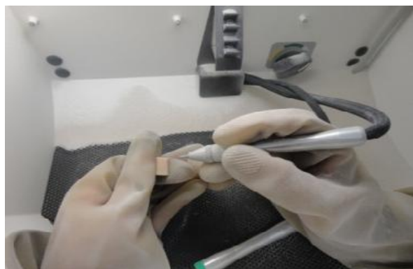
شکل ۲- عمل سندبلاست