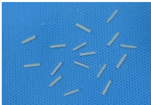
شکل ۳- نمای نمونه‌ها پس از برش

شد طبق دستور کارخانه سازنده به مدت ۱۰ ثانیه در دستگاه کیور LightStep SLI, GC Gradia شد. ۳۶ بلوک تهیه شده و به صورت تصادفی در ۱۲ گروه قرار گرفت: