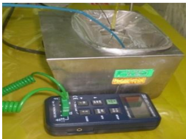
شکل ۳- اندازه‌گیری دما در سنسور عایق نشده متصل به ترموکوپل و دمای آب داخل دستگاه Heater

در جدول ۱، مقادیر میانگین و انحراف معیار دماهای اندازه‌گیری شده در زمان‌های مختلف در هنگام نوشیدن مایعات گرم و سرد در بیماران مورد مطالعه نشان داده شده است. همچنین، نمودار ۱ (الف و ب) ۹۵٪ فاصله اطمینان دماهای اندازه‌گیری شده در مایعات گرم و سرد را نشان می‌دهد. براین اساس، به دنبال نوشیدن مایعات گرم با افزایش زمان، دمای ایمپلنت نیز افزایش یافته و یک روند صعودی در این زمینه دیده شد. این افزایش دما براساس نتایج آزمون ناپارامتری Friedman از نظر آماری نیز معنی‌دار بود ( P=0/009 ). به دنبال نوشیدن مایعات سرد و همزمان با افزایش زمان،