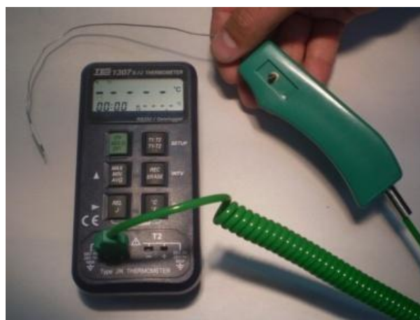
شکل ۱- دستگاه ترمومتر TES مدل 1307 Datalogging Thermometer و ترمومترهای استاندارد از نوع J-type

شاخص‌های آناتومیک وارد مطالعه شدند. برای انجام درمان، از ایمپلنت‌های Tissue level سیستم ایمپلنت (Cowellmedi Co. Ltd, South Korea) ساخت کره جنوبی استفاده شد و به منظور ثبت تغییرات حرارتی نیز از دستگاه ترمومتر TES مدل 1307 Datalogging (TESElectric Corp, Taiwan) Thermometer و سنسورهای ترمومتر استاندارد از نوع J-type استفاده شد (شکل ۱).