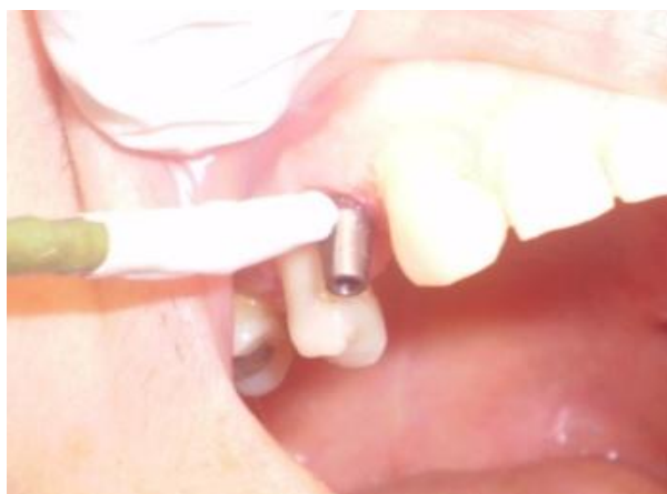
شکل ۲- باقیمانده طول سنسور با عایق مخصوص سیستم پوشانده شد و از اباتمنت سوراخ شده عبور می‌کند

قسمت سرویکال فضای داخل آن قرار داشته باشد، سنسور در خارج از دهان بیمار، یک بار از روی اباتمنت اندازه‌گیری شده و یک بار دیگر نیز، از داخل سوراخ تعبیه شده اباتمنت متصل به یک نمونه ایمپلنت عبور داده و اندازه‌گیری شد. هنگام آزمایش روی بیمار، سنسور از داخل اباتمنت ایمپلنت عبور کرده و اگر تا علامتی که قبلاً روی سنسور پیش‌بینی شده بود، داخل اباتمنت متصل به ایمپلنت قرار می‌گرفت، محل صحیح سنسور تأیید می‌شد (شکل ۲). سپس باقیمانده طول سنسور با عایق مخصوص سیستم پوشانده شد. هنگام انجام آزمایش اباتمنت بدون پیچ قرار داده شد و دسترسی پیچ در سطح فوقانی اباتمنت توسط ماده پانسمان سیل شد برای اطمینان کامل از دقت سنسور اصلی متصل به دستگاه ترمومتر آزمایشات زیر انجام شد.