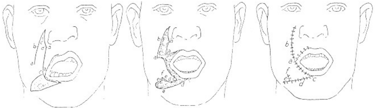
تصویر شماره ۱- کاربرد فلپ نازولابیال در بازسازی دهان (۴)

۲- خود انکایی و یافتن روشهای تازه و گشودن راههای