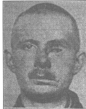
تصویر شماره ۳- بازسازی کاسه چشم (قبل و بعد از عمل) (۴)