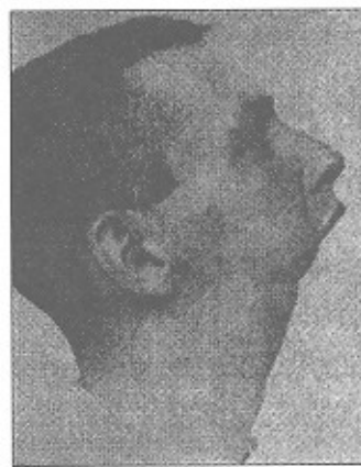
تصویر شماره ۲- بازسازی چانه (قبل و بعد از عمل) (۴)