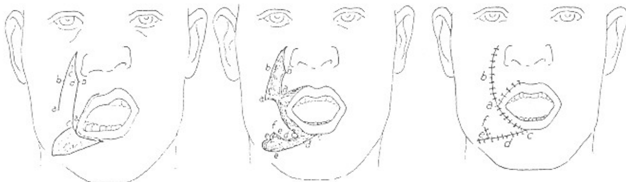
تصویر شماره ۱- کاربرد فلپ نازولابیال در بازسازی دهان (۴)

۲- خود انکایی و یافتن روشهای تازه و گشودن راههای