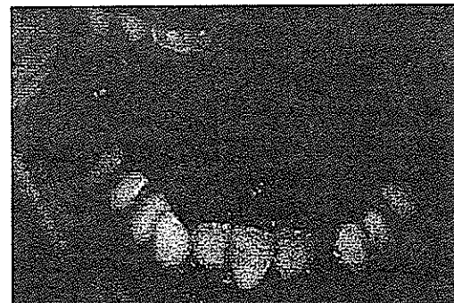
تصویر ۲- کمبود فضای موجود در فک پایین و رنگ کهربایی دندانها و تجمع جرم دندانی