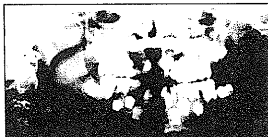
تصویر ۳- رادیوگرافی OPG بیمار- به ریشه‌های کوتاه و پالپ چمبر هلالی شکل و پالپ کانال مسدود توجه شود.