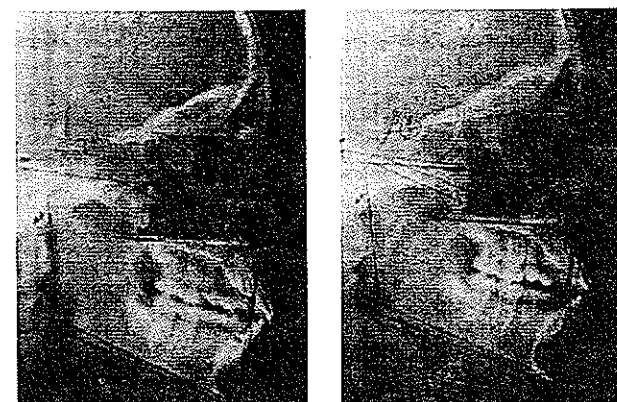
تصویر ۳- تریسینگ سفالومتری بیمار شماره ۱۲۷ در وضعیت استاندارد (سمت راست) و در وضعیت طبیعی سر (سمت چپ)