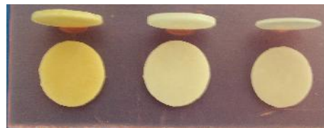
شکل ۳- نمونه‌های لامینیت و پس‌زمینه

دیسک‌های لامینیت به سه گروه ده تایی تقسیم شدند (گروه اول A، گروه دوم B و گروه سوم C) و به نمونه‌های هر گروه شماره‌ای از ۱ تا ۱۰ تعلق گرفت. دیسک‌های پس‌زمینه نیز به سه گروه تقسیم شدند. در گروه اول (از شماره A11 تا A20) دیسک‌های پس‌زمینه با رنگ A2 قرار گرفتند و دو گروه بعد نیز (B11 تا B20 و C11 تا C20) شامل دیسک‌های تغییر رنگ یافته بودند.