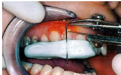
شکل ۳- روش هیستوکمیخال (HCM)

از بیماران ایندکس لثه‌ای (GI) مطابق روش Loe & Silness (۱۵) گرفته شد و آنهایی که ایندکس کمتر از ۱ داشتند، وارد مطالعه شدند. به منظور یکسان‌سازی مسیرهای اندازه‌گیری با استفاده از ماده پلی ونیل سایلوکسان یک stent اختصاصی که سطح اکلوزال و قسمتی از سطح باکال دندان مورد نظر و دو دندان مجاور را در بر می‌گرفت،