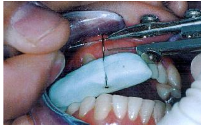
شکل ۲- روش فانکشنال (FM)