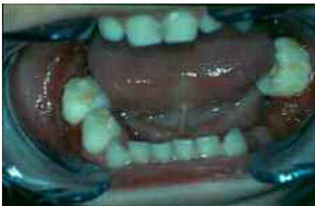
شکل ۱- تصویر داخل دهانی بیمار از فک پایین، حضور فولیکول دندان مولر اول دائمی در دهان.

در تیرماه ۱۳۸۴ پسر بچه ۳ ساله‌ای به دلیل لقی دندانها و بوی بد دهان به بخش کودکان دانشکده دندانپزشکی دانشگاه تهران مراجعه نمود. در معاینه داخل دهانی، افزایش حجم لثه‌ای به خصوص در قسمت پالاتال در خلف فک بالا با قوام سفت (firm) و با رنگ قرمز پر رنگ، لقی شدید دندانها به خصوص در نواحی خلفی فکین و حضور فولیکول دندانهای مولر اول دائمی چپ پایین و راست بالا در محیط دهان به دلیل تحلیل شدید استخوان، مشاهده شد. تمام دندانهای شیری به جز مولرهای اول و دوم سمت چپ پایین که به دلیل لقی شدید، خارج شده بودند، در دهان وجود داشتند (شکل ۱، ۲)