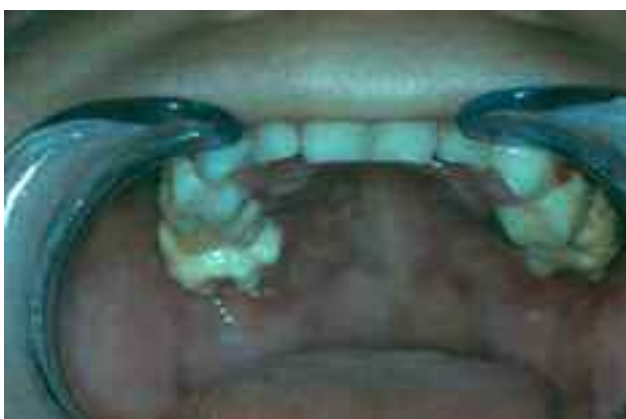
شکل ۲- تصویر داخل دهانی بیمار از فک بالا، پرولیفراسیون مخاط پالاتال و حضور فولیکول دندان مولر اول دائمی در دهان

Lichtenstein از واژه Histiocytosis X برای معرفی گروهی از ضایعات که سیستم رتیکولاندوتلیال را درگیر می‌کنند، استفاده کرد. او بیان نمود که Letterer-Siwe، Hand-Schuller-Christian و Eosinophilic Granuloma، سه تظاهر متفاوت از یک پروسه پاتولوژیک با نمای بافت شناسی یکسان و اتیولوژی نامشخص هستند (۱). امروزه عفونت ویروسی و اختلالات ایمنی با زمینه ژنتیکی را جزء علل احتمالی این بیماری می‌دانند (۲)، Nezelof و همکاران مشاهده کردند که سلولهای که در ضایعات موجود در بیماران مبتلا به Histiocytosis X وجود دارند، از نوع سلولهای دندریتیک مغز استخوان به نام سلولهای لانگرهانس می‌باشند که در بافتهای محیطی مثل پوست، مخاط دهان، تیموس، عروق خونی و غدد لنفاوی مشاهده می‌شوند. این یافته باعث شد که نام این بیماری از Histiocytosis X به Langerhans cell histiocytosis تغییر یابد (۱).