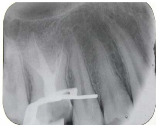
شکل ۵- تکمیل درمان ۴ کانال ریشه دندان مولر اول سمت راست فک بالا در نگاره پری اپیکال

تارودنتیسم و چگونگی نحوه درمان دندان مبتلا بود. به طور کلی امروزه تارودنتیسم را تنها یک اختلال در شکل دندان می‌دانند که نیازی به درمان نخواهد داشت، ولی در این مقاله با توجه به این که دندان مبتلا به تارودنتیسم دچار پولیپیت حاد غیرقابل برگشت شده بود، درمان ریشه نیز صورت گرفت. Tsesis و همکاران بیان نمودند که مورفولوژی این دندانها می‌تواند تعیین موقعیت مدخلهای کانال ریشه را با مشکل روبرو سازد (۸)، به طوری که در گزارش Rao و Arathi به حضور کانالهای ریشه اضافی در ریشه مزیوباکال اشاره شده بود (۹). در حالی که در مطالعه کنونی ریشه جداگانه مزیوباکال مشاهده گردید.