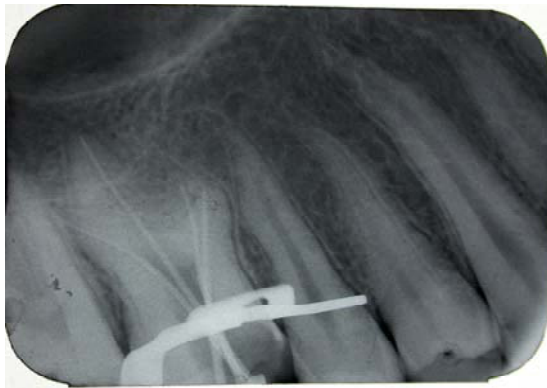
شکل ۴- کن گوتا پرکای اصلی در ۴ کانال ریشه دندان مولر اول سمت راست فک بالا در نگاره پری آپیکال

پس از تشکیل پرونده، اخذ تاریخچه پزشکی و بررسی سابقه خانوادگی بیمار، هیچ‌گونه بیماری عمومی مشخصی مشاهده نگردید. در نگاره پری‌آپیکال از دندان مورد نظر، ۳ ریشه کوتاه با ناحیه فورکای مهاجرت کرده به سمت آپیکال که براساس طبقه‌بندی Witkop و Chanannel، Shifman و Witkop که مبنای طبقه‌بندی براساس جابه‌جایی کف پالپ دندان به سمت آپکس به صورت خفیف (هیپوتارودونتیسیم)، متوسط (مزوتارودونتیسیم) و شدید (هیپرتارودونتیسیم) می‌باشد، وجود یک تارودونتیسیم شدید با اتاقک پالپ وسیع در بعد اکلوزوژنژیوالی، تشخیص داده شد (شکل ۳).