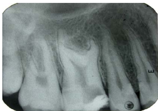
شکل ۱- هیپر تارودونتیسیم دندان مولر اول سمت راست فک بالا در نگاره پری آپیکال

بیمار پسری ۱۷ ساله بود که به علت درد شدید دندان مولر اول سمت راست فک بالا به کلینیک خصوصی مراجعه نمود. دندان مذکور به علت درگیری شدید پالپی و درد شدید ناشی از پوسیدگی عمیق و پولپیت غیرقابل برگشت در یک درمانگاه غیرتخصصی دندانپزشکی مورد درمان اورژانس اندودانتیک (پالپوتومی) قرار گرفت (شکل ۱).