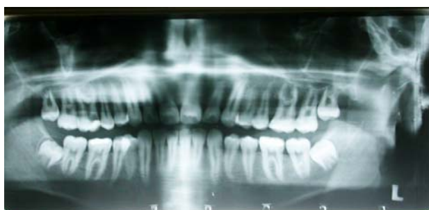
شکل ۲- هیپر تارودونتیسیم دو طرفه دندان مولر اول فک بالا در نمای ارتوپانتوموگرافی

بعد از تهیه رادیوگرافی پری آپیکال از این دندان، با توجه به ریشه‌های کوتاه و اتاقتک پالپ کشیده وجود تارودونتیسیم دندانی تأیید گردید. پس از تشخیص و نیاز به درمان ریشه، بیمار به اندودانتیست معرفی شد. لازم به ذکر است قبل از انجام درمان ریشه از بیمار رادیوگرافی Panoramic گرفته شد که نشان دهنده وجود تارودونتیسیم دو طرفه بود (شکل ۲).