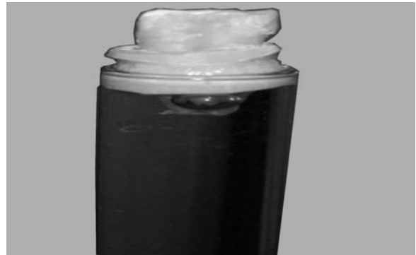
شکل ۲- مجموعه ریشه و آکريل قرار گرفته در لوله حاوی محیط کشت

جهت استریل نمودن نمونه‌ها، مجموعه لوله‌های آزمایش و آکريل و دندان در اتوکلاو قرار گرفتند.