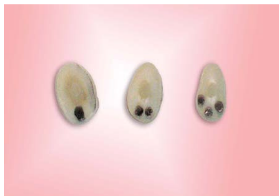
شکل ۲- قسمت های تاجی، میانی و انتهایی ریشه به ترتیب از سمت چپ

کرونا، یک سوم تاجی، یک سوم میانی و یک سوم انتهایی نام‌گذاری شد. برای شناسایی این قطعات از هم روی سطح اپیکال هر قطعه یک علامت زده شد (شکل ۲).