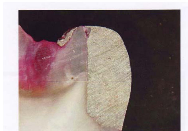
شکل ۱- نمایی از تاج دندان برش داده شده زیر میکروسکوپ (نفوذ رنگ بین ترمیم و سطح دندان فراتر از DEJ مشاهده می‌گردد).

نمودار ۲- توزیع رتبه ای میزان ریزش در حاشیه ژنژیوال گروه‌های درمانی