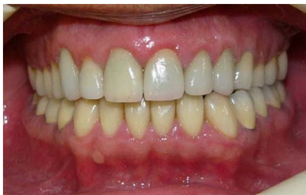
شکل ۵- نمای فرونتال پس از درمان

و Nel و همکاران در درمان بیماران AI از Porcelain veneers و Onlay سرامیکی یا فلزی استفاده کرده و نشان دادند که با گذشت ۳ سال تنها دو رستوریشن با شکست مواجه شده است (۴۳). Kostoulas و همکاران در یک بیمار ۲۴ ساله مبتلا به AI که دچار هیپوپلازی در تمام دندان‌های خود بود از لامینیت‌های چینی در دندان‌های قدامی و روکش‌های تمام سرامیک در دندان‌های خلفی استفاده کردند (۱۸). در مطالعه این محقق درمان ترمیمی پس از جراحی لثه صورت گرفت و پس از شش ماه پیگیری مشکل عمده‌ای به چشم نمی‌خورد.