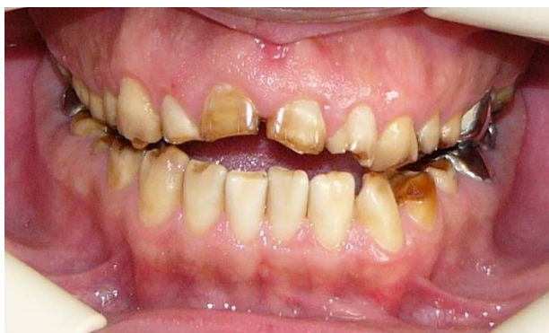
شکل ۴- نمای فرونتال قبل از درمان