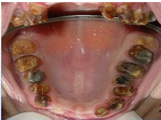
شکل ۳- آملوژنزیس ایمپرکتا نوع Hypocalcified

سایش شدید و سریع مینا بلافاصله پس از رویش دندان، حساسیت نسبت به تغییرات حرارتی، رنگ قهوه‌ای تیره در مینا، وجود ترکیبات آهکی نظیر انواع جرم و Calculus در اطراف دندان به دلیل حساسیت شدید بیمار و عدم رعایت بهداشت فردی و عدم تمایز مینا و عاج در رادیوگرافی با حداقل درصد تراکم مینایی (شکل ۳).