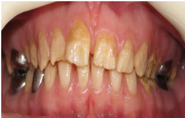
شکل ۲- آملوژنزیس ایمپرکتا نوع Hypomature

Hypomature از نوع X-linked میزان تراکم مینا طبیعی گزارش شده است (۱۹) (شکل ۲).