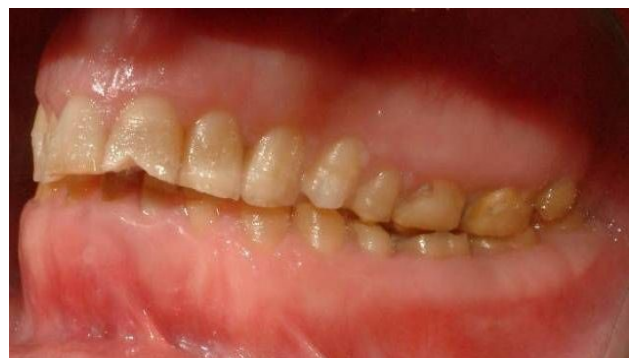
شکل ۱- آملوژنزیس ایمپرکتا نوع Hypoplastic

وجود حفرات مینایی متعدد (Pits)، سایش شدید مینایی همراه با باز شدن نقاط تماس پروکزیمالی، نمای موسوم به قله برفی (Snow-capped)، لایه نازک مینایی به رنگ زرد یا قهوه‌ای، بروز مشکل در رویش دندان‌های دائمی، وجود نهفتگی‌های متعدد و امکان تمایز مینا و عاج در کلیشه‌های رادیوگرافی (شکل ۱).