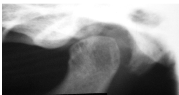
شکل ۱- تصویر ناحیه TMJ در رادیوگرافی پانورامیک با ضایعه (تصویر بالا) و بدون ضایعه (تصویر پایین)