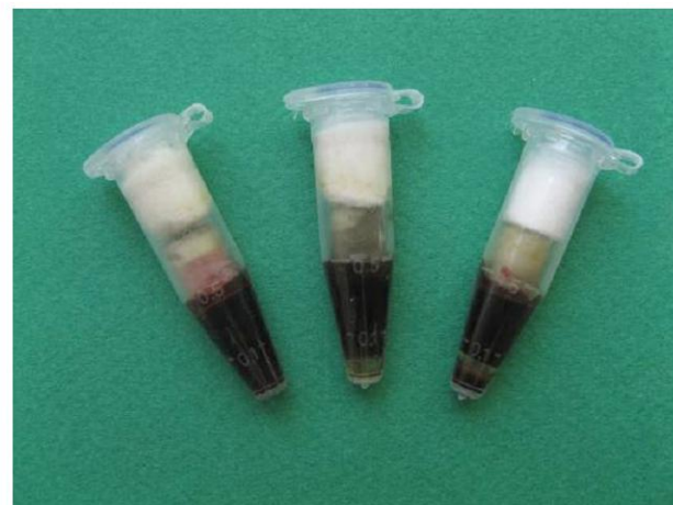
شکل ۳- قرار گیری سطح نمونه‌ها در تماس با خون

نحوه آماده‌سازی گروه‌های ۵ و ۶ مانند گروه‌های ۳ و ۴ بود با این تفاوت که مواد مورد مطالعه به جای مخلوط شدن با مایع پیشنهادی کارخانه با خون مخلوط شدند. با توجه به اینکه استاندارد در مورد مخلوط کردن این مواد با خون وجود ندارد و اینکه وزن مخصوص خون افراد مختلف متفاوت خواهد بود، تصمیم بر این شد که از حجم