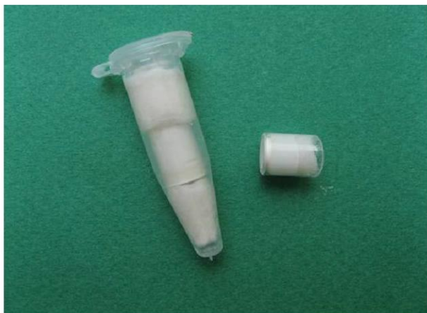
شکل ۱- قرار دادن پنبه مرطوب بر روی ماده داخل استوانه و انتقال به اپندروف

مخلوط حاصل توسط قلم پانسمان به استوانه شیشه‌ای که بر روی سطح صاف و صیقلی یک اسلب شیشه‌ای قرار داشت منتقل و به مدت ۳۰ ثانیه تحت ارتعاش دستگاه اولتراسونیک قرار می‌گرفت. برای این منظور از دستگاه اولتراسونیک Spartan MTS (Obtura/Spartan, Missouri) با قدرت متوسط (۵ از ۱۰) استفاده شد. در نهایت بر روی ماده داخل استوانه پنبه مرطوب قرار گرفت و استوانه شیشه‌ای به داخل اپندروفی که در قسمت انتهایی آن پنبه مرطوب قرار داشت منتقل شد و روی آن نیز با پنبه مرطوب پوشانده شد (شکل ۱).