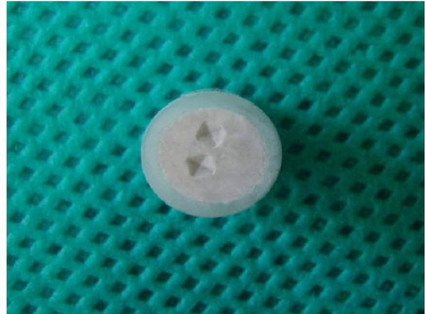
شکل ۴- اثر سنجه فرورونده (Indenter) بر سطح ماده

می‌کرد که موجب ایجاد یک فرورفتگی در سطح آن می‌شد (شکل ۴).