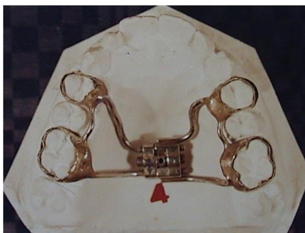
شکل ۲- دستگاه Hyrax

به تمامی بیماران در هر دو گروه توصیه شد که دستگاه خود را روزی یک (۳۶٪ بیماران) و یا دو بار (۶۴٪ بیماران) و هر بار به میزان یک چهارم دور فعال نمایند. اکسپانشن زمانی متوقف می‌شد که از نظر کلینیکی ۲ تا ۳ میلی‌متر اور اکسپانشن مشاهده می‌گردید. Sari و همکاران میزان اکسپانشن کافی را زمانی دانستند که کاسپ پالاتال مولر اول بالا روی کاسپ باکال مولر اول پایین قرار گیرد (۱۴). پس از اکسپانشن دستگاه‌های RME از دهان بیمار خارج و یک دستگاه ریتینر Hawley جهت جلوگیری از Relapse داده شد. از تمامی افراد تحت درمان در هر دو گروه دو عدد کلیشه سفالوگرام PA یکی قبل از شروع