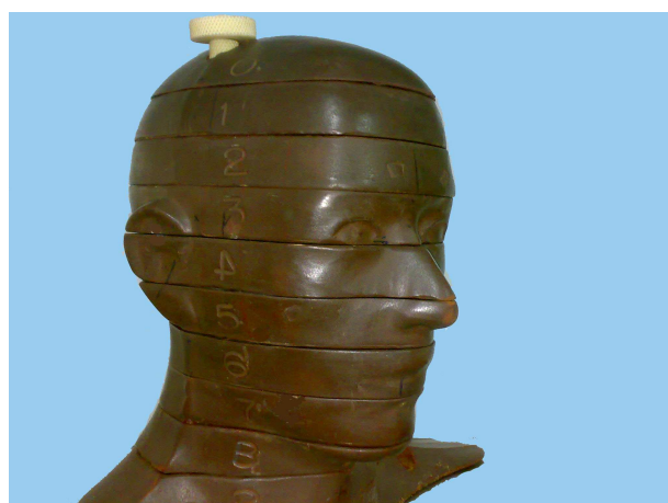
شکل ۱- فانتوم RANDO

به خاطر مقادیر نسبتاً کم اشعه دریافتی در TLDها، در هر مرتبه انجام آزمایش در تکنیک‌های پانورامیک و توموگرافی خطی، بدون جا به جا کردن فانتوم و دقیقاً در همان پوزیشن، ۵ مرتبه اکسپوز و در CBCT، ۲ مرتبه اکسپوز انجام گرفت تا مقدار اشعه‌ای که به TLDها می‌رسد یک میزان قابل اندازه‌گیری در هنگام قرائت آن باشد چرا که TLDها به مقادیر کم اشعه حساسیت پایینی دارند و ممکن است خطای اندازه‌گیری افزایش یابد. اما در تکنیک CT به خاطر بالا بودن مقدار اشعه دریافتی در هر مرتبه آزمایش فقط یکبار اکسپوز انجام گردید که این کار در مقالات مشابه نیز انجام شده است (۳،۴).