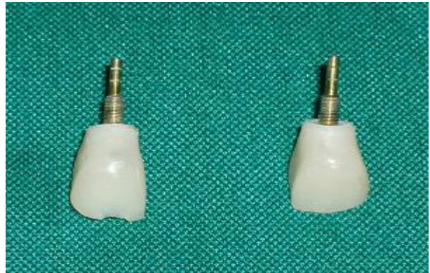
شکل ۹- رستوریشن‌های موقتی پیچ شونده

حاوی نگاره رستوریشن‌های موقتی، رستوریشن‌های PFM سمان شونده نهایی ساخته شدند.