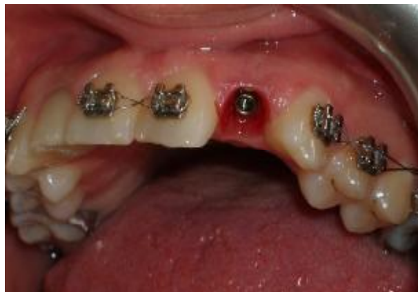
شکل ۱۲- کانتور مناسب نسج نرم پس از باز کردن رستوریشن های موقتی

در این مورد سعی شد با ساختن رستوریشن های موقتی (۱)، کانتور نسج نرم به روش غیر جراحی اصلاح شود. ایده آل ساخت رستوریشن موقتی با Titanium Temporary Abutments و کامپوزیت های لابراتواری با استحکام بالاتر بود که به علت عدم موافقت بیمار مقدور نشد که مشکلاتی از جمله استحکام کمتر را موجب می شود. به نظر می آید شکل دهی بافت نرم به وسیله رستوریشن موقتی به برقراری مجدد کانتورهای طبیعی لثه و پاپیلای بین دندانی اطراف یک رستوریشن متکی بر ایمپلنت در قدام ماگزایلا، کمک شایانی می نماید.