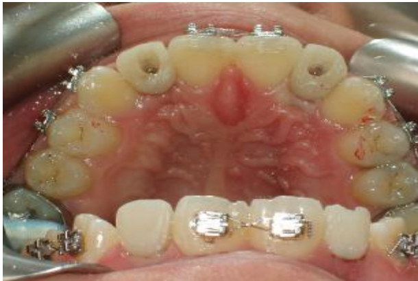
شکل ۱۰- رستوریشن‌های موقتی در زمان اتصال اولیه