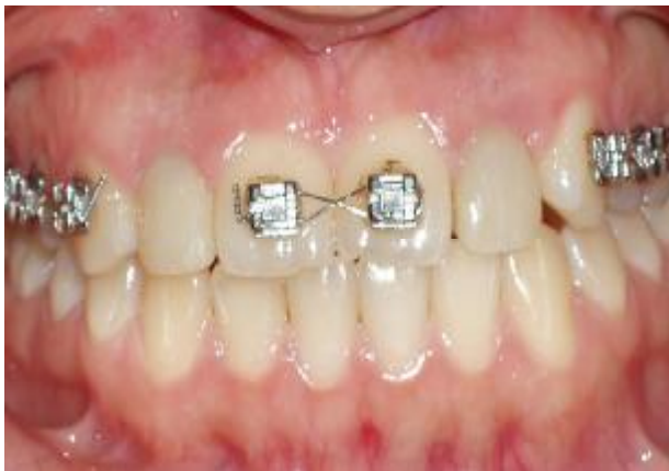
شکل ۱۱- وضعیت نسج نرم پس از سپری شدن ۲ هفته

بعد از برداشتن کامپوزیت سوراخ‌های پیچ رستوریشن‌های موقتی و بازکردن آنها، با توجه به شکل گرفتن مناسب بافت نرم (شکل ۱۲)، اباتمنت‌های 3inOne تراش خورده به راحتی روی فیکسچرها بسته شد و رستوریشن‌های نهایی، به آسانی قرار داده شدند و پس از تنظیم‌های لازم رستوریشن‌ها، گلیز و با سمان موقت