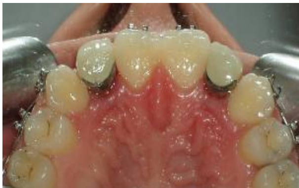
شکل ۱۳- رستوریشن های نهایی در محل