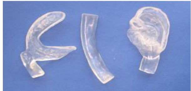
شکل ۲ - گوش آکریلی سمت چپ، بار آکریلی و رکورد اکلوزالی آکریلی