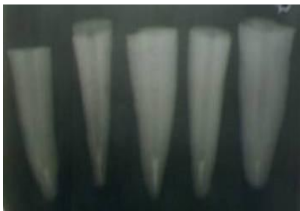
شکل ۱-تهیه رادیوگرافی جهت بررسی کیفیت پلاگ MTA

دندان‌ها به ۴ گروه ۱۰ تایی تقسیم شدند. در گروه ۱، تمام طول کانال به روش تراکم جانبی با گوتاپرکا و سیلر AH26 پر شد. سپس با استفاده از اینسترومنت داغ ۱۰ میلی‌متر گوتای کروئال تخلیه و قسمت آپیکال به وسیله پلاگر تراکم شد به گونه‌ای که پلاگ آپیکالی به ضخامت ۵ میلی‌متر باقی بماند. در گروه ۲، ۳ و ۴ به ترتیب ناحیه آپیکال به صورت مستقیم (دسترس تاجی) با استفاده از Pro root