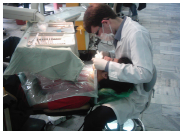
شکل ۴- نمونه‌ای از وضعیت بدن دانشجویان در حین انجام کار به وضعیت گردن که از حالت طبیعی خارج شده توجه کنید.

این روش در یک مشاهده کوتاه مدت می‌تواند پوسترچر افراد را ارزیابی کند. در این روش قسمت‌های مختلف بدن برای آنالیز در دو گروه A و B قرار می‌گیرند. در گروه A پوسترچر تنه، گردن و پاها قرار می‌گیرند. مقدار بار و نیرو نیز ثبت می‌شود. در گروه B بازوها، ساعد و نحوه اتصال دست با وسیله قرار دارند. این اطلاعات توسط روش مشاهده مستقیم به دست می‌آید. زمان مشاهده برای هر پوسترچر کاری ۳۰ دقیقه می‌باشد. برای ارزیابی دقیق‌تر از هر پوسترچر کاری یک یا چند عکس تهیه می‌شود (شکل ۴). پس از بررسی پوسترچر افراد، نمره نهایی REBA به دست می‌آید که عددی بین ۱ تا ۱۵ برای هر سمت بدن می‌باشد. بر اساس این نمره پوزیشن فرد به ۵ رتبه تقسیم می‌شود که بر اساس آن سطح خطر و میزان نیاز به اصلاح پوزیشن فرد تعیین می‌شود. به طور مثال اگر پوزیشن فرد به گونه‌ای باشد که نمره آن ۱۲ باشد، این فرد در سطح خطر بالایی از لحاظ ابتلا به بیماری‌های اسکلتی عضلانی قرار دارد و نیاز فوری به اصلاح وضعیت بدن خود در حین کار دارد.