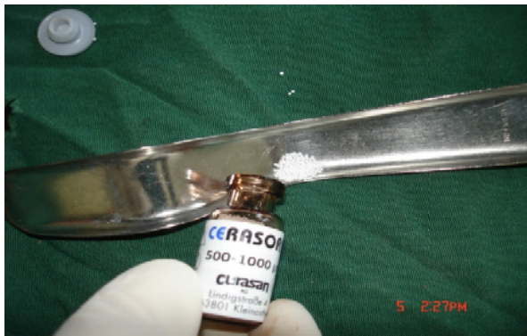
ج- استفاده از Cerasorb در سمت تست