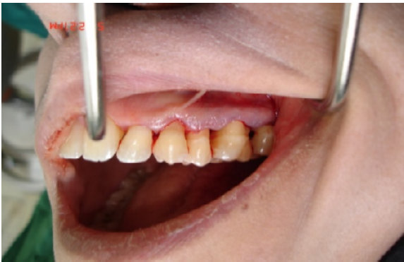
شکل ۲ - مراحل جراحی الف) برش سالکولار در سمت باکال