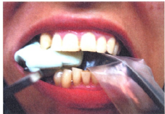
ج) Sensor و Template با XCP در دهان بیمار

در ضایعات گروه کنترل در این مرحله به جای Cerasorb از Autogenous Bone Graft استفاده شد، به این ترتیب که پس از تمیز کردن ضایعه و آماده‌سازی محل، جراحی اضافه برای برداشتن Autogenous Bone در ناحیه توبروزیته یا رترومولر انجام گرفت و استخوان به صورت مخلوط اسفنجی و کورتیکال تهیه گردید (شکل ۲).