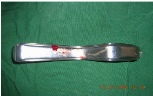
د- استفاده از A.B.G در سمت کنترل