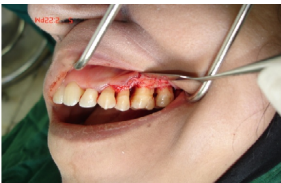
ب) بلند کردن فلپ موکوپریوستال