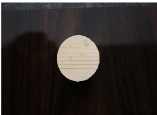
شکل ۲- نمونه گچی زیر دوربین از فاصله ۱۵ سانتی متری

برای اندازه‌گیری میزان ثبت جزئیات شیار ۵۰ میکرومتری با میکروسکوپ نوری با بزرگنمایی ۱۲ برابر مشاهده شده و هر نمونه در یکی از گروه‌های زیر قرار گرفت: