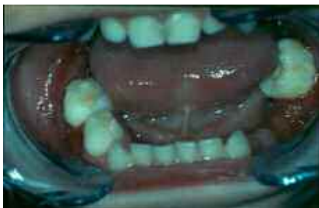
شکل ۱- تصویر داخل دهانی بیمار از فک پایین، حضور فولیکول دندان مولر اول دائمی در دهان.

در تیرماه ۱۳۸۴ پسر بچه ۳ ساله‌ای به دلیل لقی دندانها و بوی بد دهان به بخش کودکان دانشکده دندانپزشکی دانشگاه تهران مراجعه نمود. در معاینه داخل دهانی، افزایش حجم لثه‌ای به خصوص در قسمت پالاتال در خلف فک بالا با قوام سفت (firm) و با رنگ قرمز پر رنگ، لقی شدید دندانها به خصوص در نواحی خلفی فکین و حضور فولیکول دندانهای مولر اول دائمی چپ پایین و راست بالا در محیط دهان به دلیل تحلیل شدید استخوان، مشاهده شد. تمام دندانهای شیری به جز مولرهای اول و دوم سمت چپ پایین که به دلیل لقی شدید، خارج شده بودند، در دهان وجود داشتند (شکل ۱، ۲)