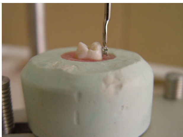
شکل ۱- استفاده از سورویور به منظور قرار دادن صحیح براکت