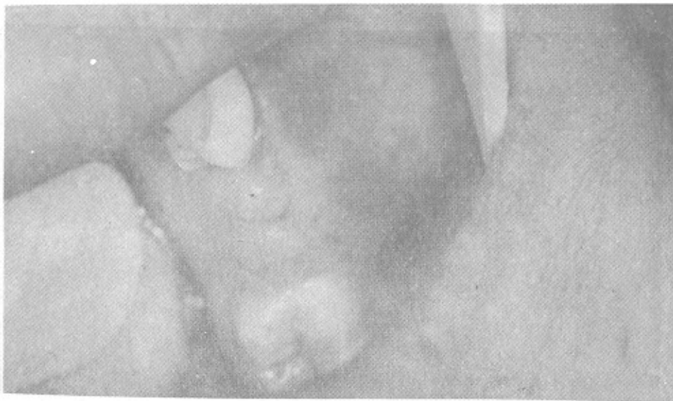
شکل ۲- Expansion باکالی ضایعه را نشان می دهد