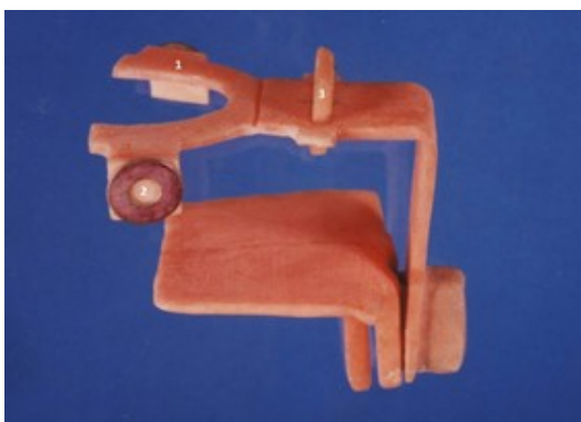
شکل ۲- قسمت متحرک دستگاه HPSI در اتصال با قسمت ثابت. شماره ۱: بایت پلیت، شماره ۲: صفحه حامل حلقه‌های فلزی، شماره ۳: صفحه‌ای مربع شکل حامل چهار سیم فلزی عمود به هم.

۲- دو صفحه عمود بر سطح افق، حامل حلقه‌های فلزی هم اندازه که از نظر موقعیت فضایی در وضعیت کاملاً قرینه‌ای نسبت به mid sagittal plane قرار گرفته بودند (مقایسه قطر دایره ایک نقش بسته روی گرافی، توانایی کنترل میزان بزرگنمایی دو سمت یک کلیشه پانورامیک یا بزرگنمایی در کلیشه‌های مختلف را امکان‌پذیر می‌کرد).