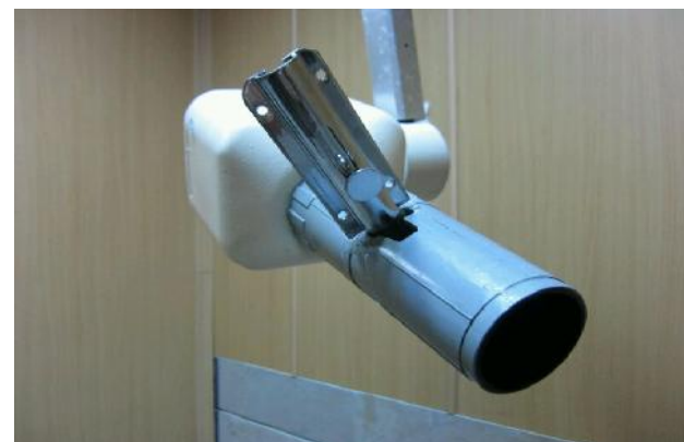
شکل ۲- نشانگر لیزری