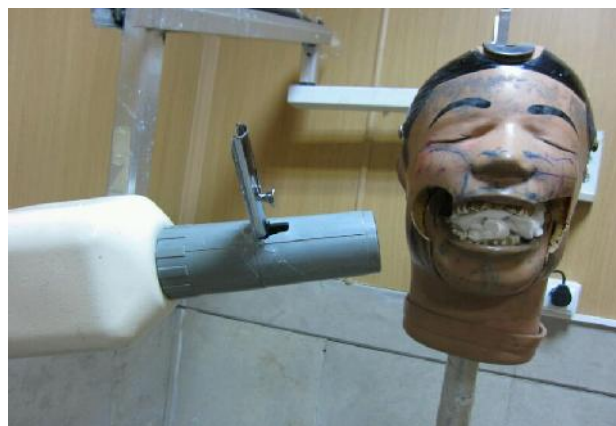
شکل ۱- نشانگر لیزری و فانوم

تصادفی (به هر دانشجو یک کد داده شد و سپس به صورت تصادفی کدها انتخاب شدند) تقسیم بندی شده بودند شرکت کردند. هر دو گروه، تحت آموزش رادیو عملی ۱ قرار گرفتند، سپس دانشجویان به دو گروه مداخله و مقایسه تقسیم بندی شدند. گروه مداخله با نشانگر لیزری و گروه مقایسه بدون استفاده از نشانگر لیزری تمرین کردند (اشکال ۱-۳).