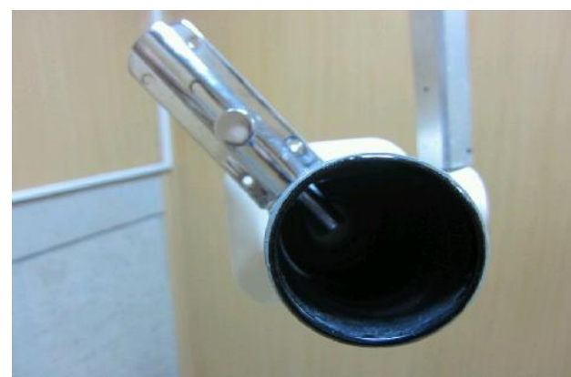
شکل ۳- تصویر کشوی رفت و برگشت نشانگر لیزری